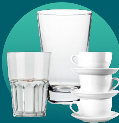
玻璃杯、茶杯、马克杯