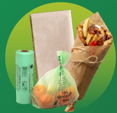
Khăn Ăn, Túi Đựng Rau Củ & Giấy Gói Thực Phẩm