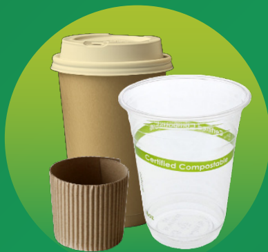
Cốc Đựng Đồ Nóng/Lạnh, Nắp & Tay Quai Ly Giấy