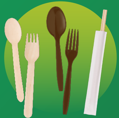
Nĩa, Dao, Thìa & Đũa