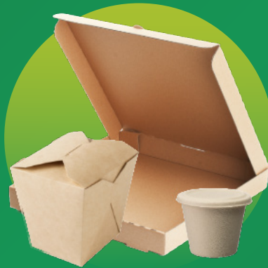
Hộp & Hộp Đựng Thức Ăn