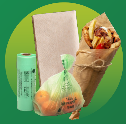
餐巾纸、包装袋、食品接触纸