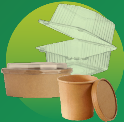
접이식 용기 & 사발