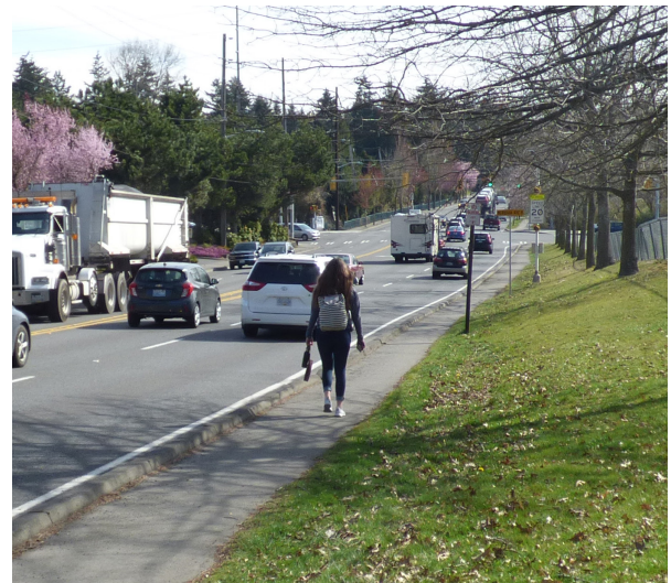
Ang 175th Street ay isa sa mga pinakamataong daan ng Shoreline mula silangan hanggang kanluran.

Ang 175th Street corridor ay isa mga pinaka-aktibong daanan ng Shoreline mula silangan hanggang kanluran na kumokonekta sa mga pinakamataong daan mula hilaga hanggang timog: State Route 99/Aurora Avenue N, I-5, at 15th Avenue NE. Ginawang priyoridad ng Shoreline ang pagpapabuti ng 175th Street sa pagitan ng Stone Avenue at I-5 sa pamamagitan ng paggawa nitong mas madali at mas ligtas para sa lahat ng gumagamit ng corridor. Maaaring kabilang sa mga pagpapabuting ito ang mga paraan upang bawasan ang kasikipan ng trapiko, pagkompleto sa network ng mga bangketa, pagpapalawak ng mga mapagpipiliang uri ng transportasyon, paggawa ng mga pasilidad para sa mga bisikleta sa corridor mismo o katabi nito, at paggawa ng kabuuang disenyong sumusuporta sa hinaharap na paglago ng mga komunidad na katabi ng 175th Street.