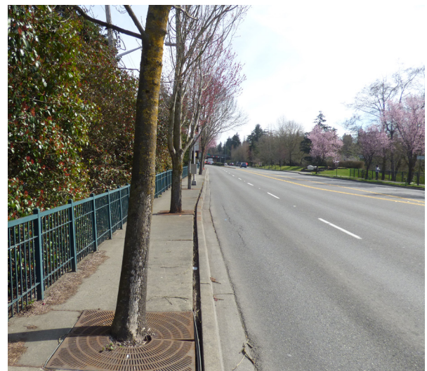
May mga bahagi ng 175th Street na hindi magamit ng lahat ng tao, tulad ng mga gumagamit ng stroller at wheelchair.

Bago kami nagsimulang mag-isip ng proyekto sa 175th Street corridor, inaaral ng aming pangkat ang daloy ng trapiko, sinusuri ang mga pangangailangan ng kaligtasan, at tinitingnan kung paano gagawing mas madalipara sa mga taong naglalakad, nagbibisikleta, nagmamaneho, at bumibiyahe na gamitin ang lahat ng ating corridor ng trapiko. Nakatulong ang mga mungkahi ng mga residente para sa ibang mga proyekto sa lugar na tukuyin ang mga priyoridad ng Lungsod at nakatulong ito sa pagtukoy ng 175th Street bilang priyoridad na proyekto sa Pangkalahatang Plano sa Transportasyon (Transportation Master Plan) noong 2011. Natutugunan ng proyektong ito ang marami sa ating mga layunin sa transportasyon na tinukoy sa Elemento ng Transportasyon sa Komprehensibong Plano (Comprehensive Plan Transportation Element) noong 2012 at sa Polisiya sa Mga Kumpletong Daan (Complete Streets Policy), kung saan kabilang ang paggawa ng mas maraming mapagpipilian sa pagbibiyaha, pagbibisikleta at paglalakad.